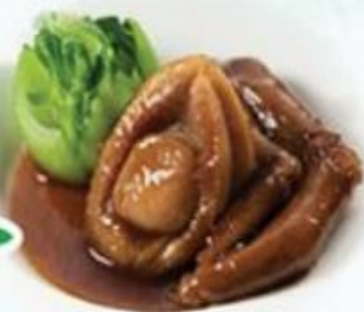
蠔皇南非鮑魚扣玉掌 $128/位 蠔皇花膠扣玉掌 $88 /位