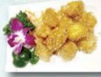
脆皮柚子明蝦球 $188/例