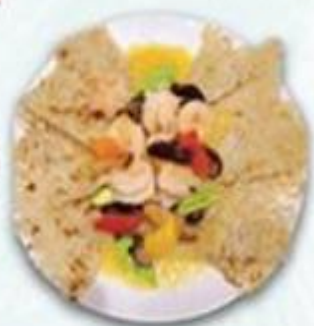
上湯大蝦球煎米粉底 $238/例