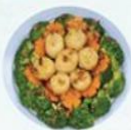
XO醬西蘭花炒澳洲帶子 $198/例