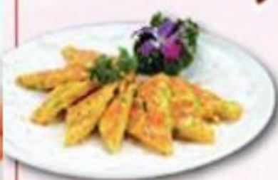
涼瓜肉碎煎蛋角 $128/例