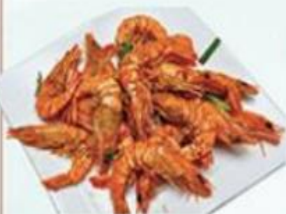
椒鹽大海蝦 / 例 $168