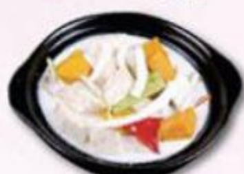
椰汁香芋南瓜煲 $128/例

翡翠花菇燒豆腐 蟲草竹筍泡菜苗 南乳溫公齋煲 竹筍羅漢上素 鮮枝竹茄子煲 麵醬炒唐生菜