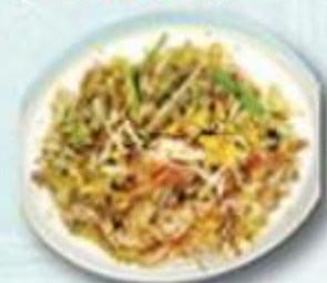
蟹子蝦乾椰菜粉絲 $148/例