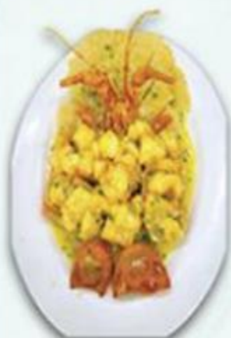
上湯澳洲龍蝦 時價 煎米粉底 / 伊麵底