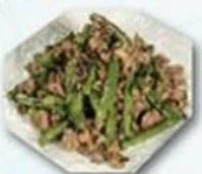
欖菜肉鬆四季豆 $98/例