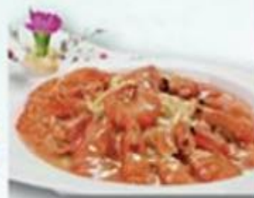
上海大海蝦伊麵 (10隻) $268