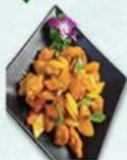
脆皮鮮果咕嚕肉 $128/例