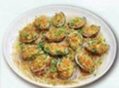
(食法: 蒜茸粉絲蒸) 果皮蒸椒鹽大蓮鮑魚 $38/隻 (2隻起)