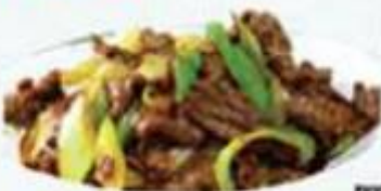
孜然京蔥爆牛肉 $128/例